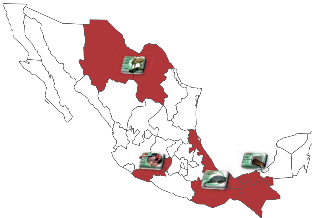
Mapa 2. Zonas de extracción de especies en México