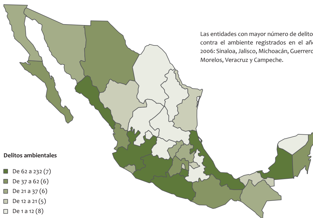
Mapa 4. Incidencia de los delitos contra el ambiente en México