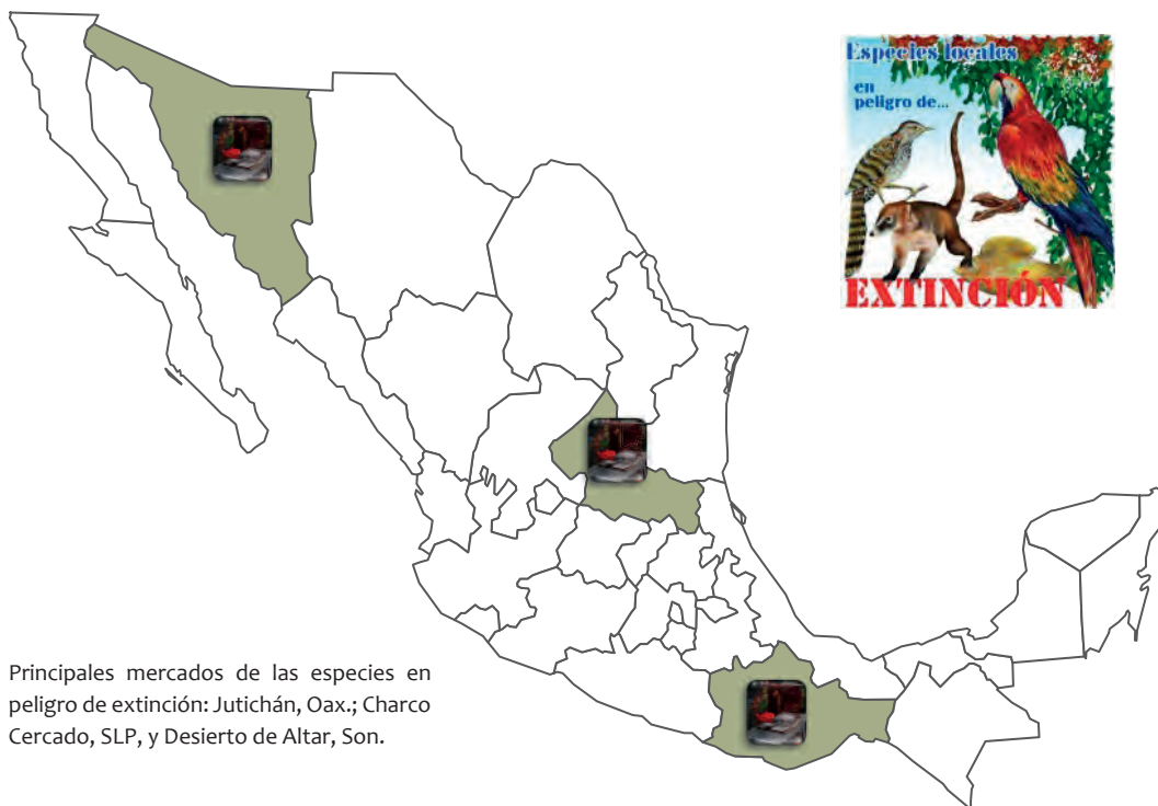
Mapa 1. Mercados de especies en peligro en México

Principales mercados de las especies en peligro de extinción: Jutichán, Oax.; Charco Cercado, SLP, y Desierto de Altar, Son.