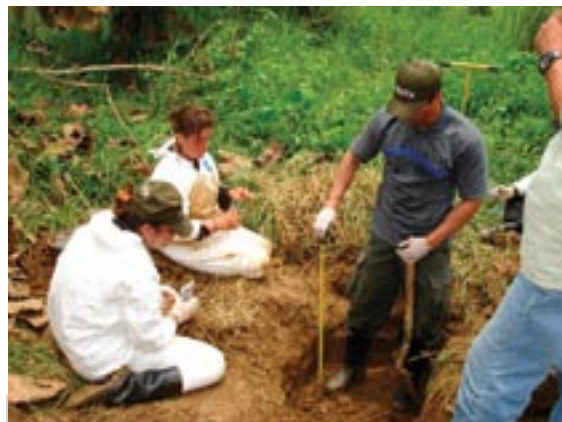
Exhumación del cuerpo de Carlos Castaño Gil. Septiembre de 2006. Plano medio. Toma realizada en el momento en que personal de la DIJIN y la Fiscalía se encuentran midiendo la profundidad de la excavación que se está abriendo para realizar la exhumación.

Cerca de 68 mil víctimas que han denunciado hechos de lesa humanidad a nivel nacional desde la expedición de la ley de Justicia y Paz, han permitido un desarrollo paulatino de la juridicidad aplicada para tal fin –que aún requiere un mayor involucramiento de la sociedad colombiana en su conjunto para no hacer creer a las nuevas generaciones del país, que lo sucedido durante interminables ciclos de violencia es una predestinación trágica a repetir–, en el sentido de que la vida interrumpida de manera intempestiva, la naturaleza de la muerte violenta relacionada de manera directa con el mundo de la criminalidad y la existencia de una vida después de ella, implican funciones psicológicas, sociológicas y sim-