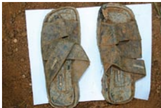
Exhumaciones en el Departamento del Magdalena. Marzo de 2008. Calzado encontrado, perteneciente a una de las víctimas de fosas comunes.

Desde la promulgación de la Constitución de 1991, las fosas comunes están proscritas en Colombia y los cuerpos de las personas no identificadas o no reclamadas por sus familiares y allegados deben inhumarse en fosas individuales y registrarse debidamente, de manera que ante un eventual reconocimiento puedan ser fácilmente localizados y entregados los restos a sus familiares 7 . "El problema es que no se está ventilando suficiente, todo lo que se está encontrando y la única posibilidad de que la sociedad escarmiente sobre crímenes atroces es que conozca lo que pasó. Nosotros estamos bien informados, pero no es información lo que necesitamos, es conocer lo que ha implicado esa violencia. El dolor, el duelo, el desarraigo" 8 .