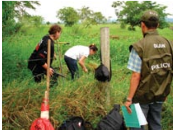
Exhumación del cuerpo de Carlos Castaño Gil. Septiembre de 2006.

De hecho, cuando se vulnera la carne de otro, el espíritu que rige el proyecto vital, sus derechos o las posibilidades de “ser”, se aprecia que la violencia es un fenómeno social bien instalado en los genes mismos del origen del mundo, pero también en doble vía y como antítesis –replicando el Ying y el Yang– en la posibilidad de cura o vacuna para sanar el cuerpo y el alma de individuos o pueblos enteros que ritualizan e imaginan el camino de vejaciones e injusticias en aras de