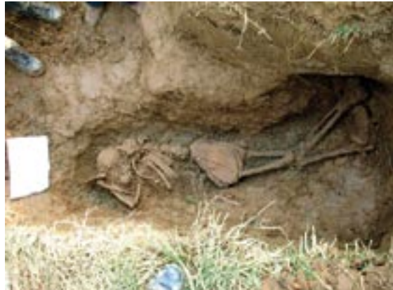
Exhumación del cuerpo de Carlos Castaño Gil. Septiembre de 2006. Plano general. Toma realizada al lugar donde se va a realizar la diligencia judicial, ubicada en el Municipio de Valencia, Corregimiento de Guasimal, Departamento de Córdoba.

Luego de la desmovilización de 31.751 integrantes de los grupos de autodefensas, producto del proceso de paz adelantado con el Gobierno Na-