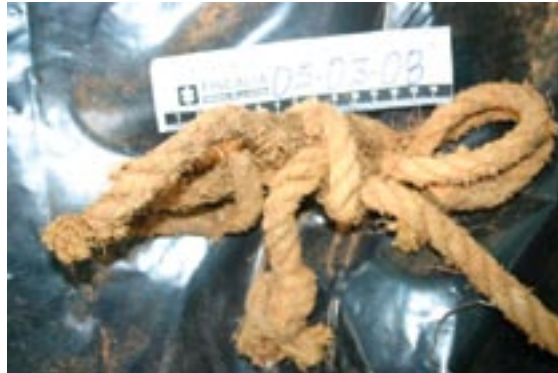
Exhumaciones en el Departamento del Magdalena. Marzo de 2008. Cuerda utilizada para atar a la víctima en sus extremidades.

En este contexto, la historia de las negociaciones del Presidente Andrés Pastrana con las guerrillas sentarán precedentes para futuras negociaciones, procesos de justicia y reconciliación. En el caso del actual proceso de paz emprendido por el presidente Álvaro Uribe Vélez, la firma del Acuerdo de Santa Fe de Ralito en julio de 2003 marcó el inicio de negociaciones para la desmovilización y reintegración de fuerzas irregulares de autodefensa, aunque algunos de los que no hicieron parte de este proceso formaron nuevos grupos, fragmentados, generando nuevos ciclos