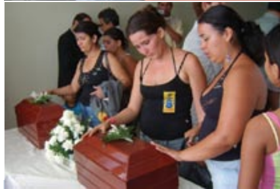
Momentos en que el Señor Fiscal General de la Nación, Mario Iguarán, hace entrega de los restos hallados, en medio del actual proceso de justicia transicional a familiares de víctimas, por hechos atroces, halladas en fosas comunes.

que las autoridades logren ahondar en un verdadero contexto de justicia y reparación, en lo atinente al descubrimiento de fosas comunes ilegales; mucho más cuando no tienen la presión de los grandes cabecillas.