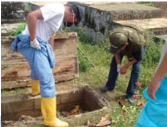
Ilustración de la labor desempeñada por antropólogos forenses del CTI en coordinación con el Grupo Investigativo de Justicia y Paz de la DIJIN en una fosa común inhumada ilegalmente. Tierradentro, departamento de Córdoba. Febrero de 2007.

En el siglo XIX se buscaba castigar al enemigo y aplicarle dolor. Los victimarios de esa primera violencia social y política del país, es decir, la ejercida por pájaros y chulavitas no es muy disímil en sus modus operandi de los métodos de desaparición forzada, de tortura y aniquilamiento de las víctimas por parte de los grupos al margen de la ley, actualmente. La crueldad es propia de la especie humana. Se ha vivido en distintos países, pero en Colombia hay persistencia en las prácticas de desmembramiento. Así como los victimarios intentan borrar la evidencia, los habitantes de los pueblos las resucitan al rezar a las ánimas e invocar protecciones que solo ellas pueden dar 17 , en el sentido de que el hombre a diferencia de los animales posee un sello de infinitud, que lo hace trascendente y que determina también la forma en que los victimarios quieren desaparecer a sus elegidos. Algunos investiga-