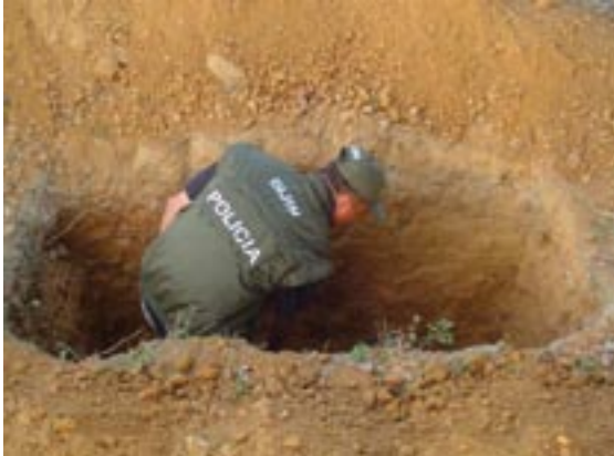
Excavaciones realizadas en búsqueda de restos óseos esqueletizados inhumados de manera ilegal.

De acuerdo al proceso investigativo del Grupo de Justicia y Paz de la DIJIN, que ha permitido el hallazgo de 1.157 fosas comunes, durante el periodo 2006-2007, los resultados han conducido a descubrimientos escabrosos, tales como restos esqueletizados, cráneos con vendas aún intactas sobre las cuencas oculares; sogas, cuerdas y otros implementos de tortura como dagas y cuchillos.