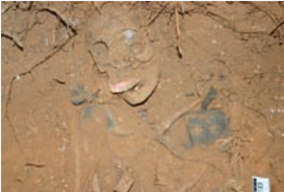
Exhumaciones en el Departamento del Magdalena. Marzo de 2008. Mujer hallada en fosa común, atada y posiblemente torturada.

y con muchos contratiempos, dada la historicidad de los conflictos sociales, la influencia de problemáticas estructurales, los términos de los procesos investigativos, los recursos disponibles, el consenso, la capacidad interinstitucional, y demás aspectos determinantes para el conocimiento de la verdad 11 , en atención a la multiplicidad de casos por atender y a los paradigmas culturales que enfrentan los investigadores, al retomar las confesiones de los victimarios, pero de manera perentoria, el relato de las víctimas.