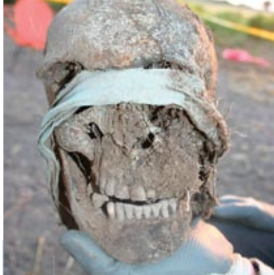
Exhumaciones en el Departamento del Cesar. Marzo de 2008. Ilustración que muestra la manera como las personas eran vendadas y torturadas al momento de ser asesinadas e inhumadas ilegalmente.

Los investigadores también hacen alusión al lugar de los hechos de la toma del Palacio de Justicia en noviembre de 1985, trágica circunstancia en la que deliberadamente se inhumaron restos de víctimas incineradas por la conflagración. Casi veinte años después de estos acontecimientos aún permanecen algunos restos de las víctimas sin identificación técnica por razones de contaminación genética con otras sustancias del medio en el que fueron depositados 5 . Durante la misma década, la guerra desatada por los grandes carteles de la droga, permitió conocer a través del descubrimiento de fosas comunes, métodos utilizados para realizar sus cobros, venganzas personales y demás prácticas