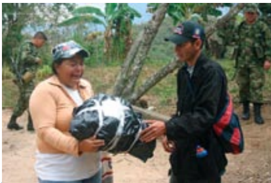
Exhumaciones en el Departamento del Magdalena. Marzo de 2008. Una mujer solicita a la comisión investigadora recibir los restos de su hijo para expresar su dolor y hacer una oración.