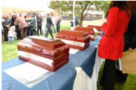
Entrega de cuatro restos óseos a familiares, llevada a cabo en las instalaciones de la DIJIN en Bogotá. 4 de junio de 2007.

De esta referencia metafórica se establece que la experiencia actual, independientemente del contexto territorial y estatal; la planificación y elaboración de estrategias de justicia y reconciliación